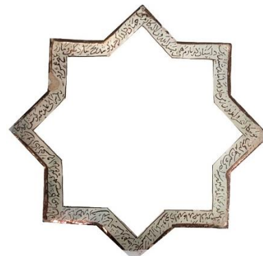
شکل ۸: آیکن نوشتار در کادر حاشیه کاشی، شامل ابیات و تاریخ ساخت Fig. 8: The image of the text in the border of the tile, including verses and the date of construction