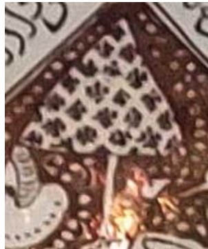
شکل ۷: آیکن سایبان بالای سر اسب سوار میانی Fig. 7: Image of the canopy above the head of the middle horseman