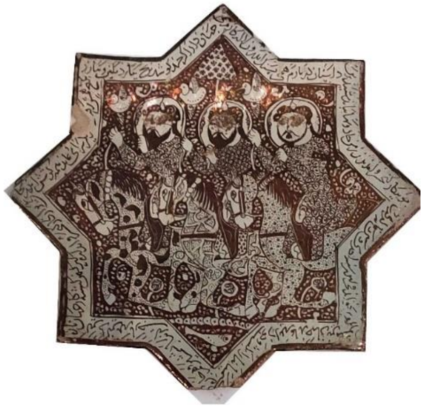
شکل ۲: کاشی شمسه یا کوکبی متعلق به امامزاده اسماعیل، نگهداری در موزه قم Fig.2: Shamsheh or Kukbi tile belonging to Imamzadeh Ismail, kept in Qom Museum