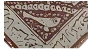
شکل ۵: آیکن برکه آب و ماهی Fig. 5: The image of a water pond and fish