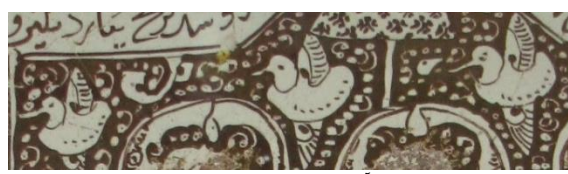
شکل ۶: آیکن سه پرنده در حال پرواز Fig. 6: The image of three birds in flight