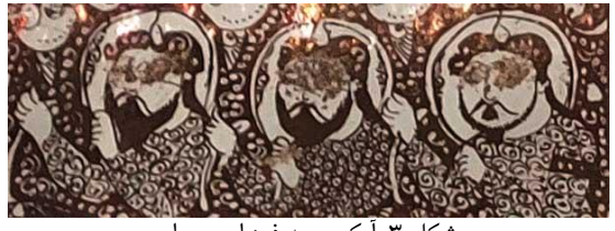
شکل ۳: آیکن سه فرد اسب سوار Fig. 3: The image of three people on horseback