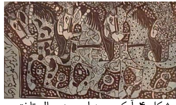
شکل ۴: آیکن سه اسب در حال تاختن Fig. 4: The image of three galloping horses