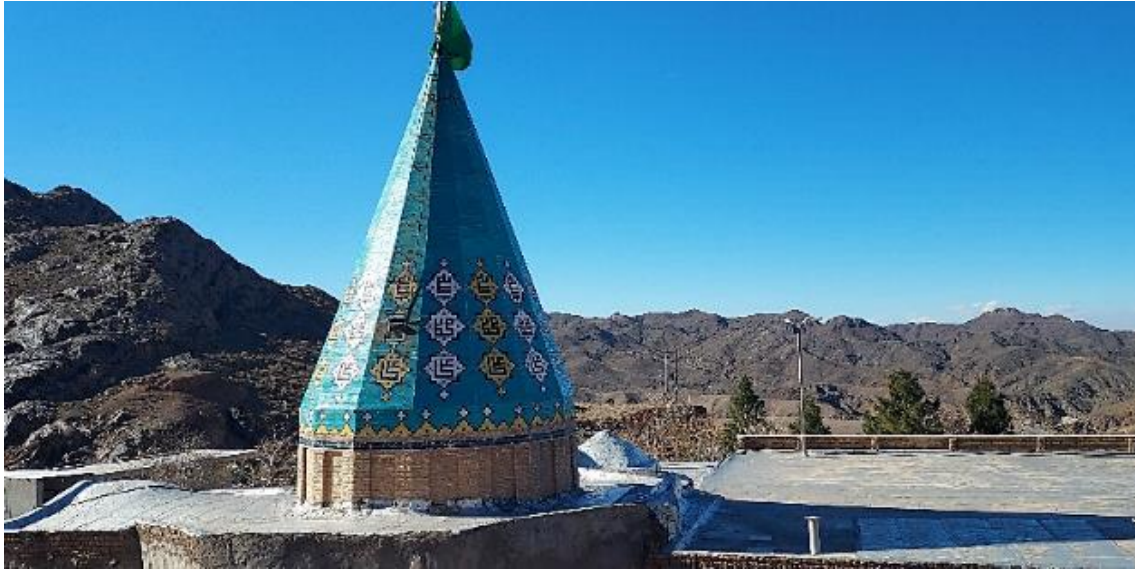
شکل ۱: نمای گنبد و بنای امامزاده شاه اسماعیل در قم (نگارنده)

کاشی کاری شده است. تمام اضلاع گنبد دارای کتیبه‌ای به خط بنایی با عبارات الله، محمد و علی است. بنای امامزاده شاهزاده اسماعیل دو بار، یک مرتبه در سال ۹۲۰ هـ ق و در عهد سلطنت شاه اسماعیل و بار دوم در سال ۱۲۱۴ هـ ق و در دوره فتحعلی شاه تعمیر و تزئین گردیده است. منبری در امامزاده به تاریخ ۹۲۲ هـ ق قرار دارد و تزئینات زیبایی بر آن به چشم می‌خورد. تعدادی از درهای بنا نیز احتمالاً متعلق به همین تاریخ است. همچنین درگاه بقعه از رواق، کاشی کاری زیبایی از دوره قاجاری است با کتیبه‌های بسیار (https://www.cgie.org.ir).