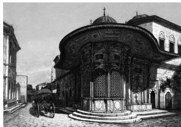
تصویر ۶: حسین ذکایی، چشمه عبدالحمید دوم، ۱۹۱۱، رنگ و روغن روی بوم (Shaw, 2011: 98)

ابراهیم چلی (۱۹۶۰-۱۸۸۲) (Ibrahim Calli) از نخستین فارغ التحصیلان آکادمی هنرهای زیبای استانبول بود. او بعد از تحصیل در پاریس تحت تاثیر امپرسیونیسم قرار گرفت. از جمله تاثیرات غربی که در آثار او دیده می شود تاکید بر فیگور است. پیش از این، فیگور انسانی در ابعاد کوچک و به عنوان بخشی از مناظر شهری و طبیعی بود. ابراهیم چلی، خلیل پاشا (۱۹۵۷-۱۸۸۲) (Halil Pasa) و دیگر هم عصرانش مانند مهتری مشفق ۸ (۱۹۵۰-۱۸۸۶) نسل دوم هنرمندان عثمانی بودند که ایشان را با نام نسل ۱۹۱۴ یا امپرسیونیست های ترکیز می شناسند. این هنرمندان، حلقه واسط بین غرب گرایی اواخر عثمانی و مدرن گرایی جمهوری ترکیه بودند، به عبارتی رویکرد این عثمانی و مدرن گرایی جمهوری ترکیه بودند، به عبارتی رویکرد این هنرمندان حدفاصل زیبایی شناسی آکادمیک و زیبایی شناسی مدرنیسم