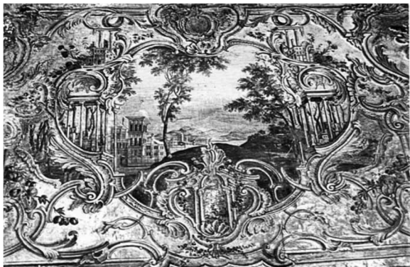
تصویر ۲: هنرمند ناشناس، نقاشی منظره در اتاق سلطان عبدالحمید اول، ۱۷۷۹-۱۷۷۴ (Shaw, 2011: 14)