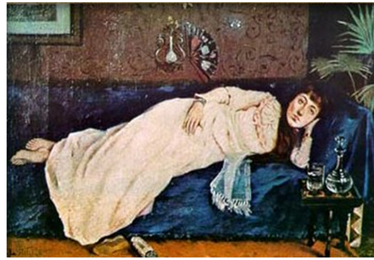
تصویر ۸: خلیل پاشا، زن لمیده، بدون تاریخ، رنگ و روغن روی بوم، ۶۰×۴۱ سانتی متر. محل نگهداری در MSGSU موزه استانبول برای نقاشی و مجسمه‌سازی (Shaw, 2011: 86)

عهد عثمانی، توجه به هنر و از جمله نقاشی فزونی یافت، زیرا پذیرش هنر مدرن به عنوان شروط لازم و از نشانه‌های «متمدن شدن» یک ملت بود. آتاتورک بنیانگذار جمهوری ترکیه اظهار داشت: «ملتی که نقاشی را نادیده می‌گیرد، ملتی که مجسمه‌ها را نادیده می‌گیرد، و ملتی که قوانین علم پوزیتیو را نمی‌داند، استحقاق یافتن جایگاه خویش در مسیر پیشرفت را ندارد» (Naef, 2003: 166). از این رو «هنر غربی» نمادی از تمدن و «هنر اسلامی» نمادی از عقب‌افتادگی بدل شد و هنرمندان تا حد ممکن از فرهنگ و هنر عثمانی فاصله گرفتند و به جنبش‌های مدرن جلب شدند، این گرایش‌ها مورد حمایت دولت نیز بود. پس از استقرار جمهوری، اولین موزه در سال ۱۹۳۸ تاسیس شد و گروه‌های هنری یکی پس از دیگری شکل گرفتند مانند گروه مستقلان (Müstakiller (The Independents)، گروه D، گروه تازه واردان (Yeniler Grubu (The Newcomers Group)، گروه ده، گروه قلم سیاه، و تاکید بر هویت مدرن و ملی در قالب نمادهای بیانگری مانند آنکارا به عنوان پایتخت جدید یا حتی زنان عربان و حتی خود رهبر جمهوری یعنی «آتاتورک» نمایان می‌شود (تصویر ۱۰). بر اساس آنچه در بالا آمد می‌توان گفت، افق اجتماعی عثمانی از قرن ۱۹ تا سده بیستم مدرنیزاسیون یا نوسازی است که معادل است با غرب‌گرایی و اتخاذ الگوهای غربی برای پیشرفت و در جمهوری ترکیه معادل است با مدرن‌گرایی که سکولاریسم، ملی‌گرایی و جمهوری از مصادیق آن است. جدول شماره یک خلاصه‌ای از آنچه گفته شد نشان می‌دهد.