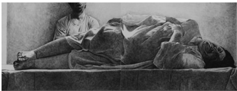
شکل ۲: احمد مرشدلو، چشم سر، ۱۳۸۷ (URL1, 2021)