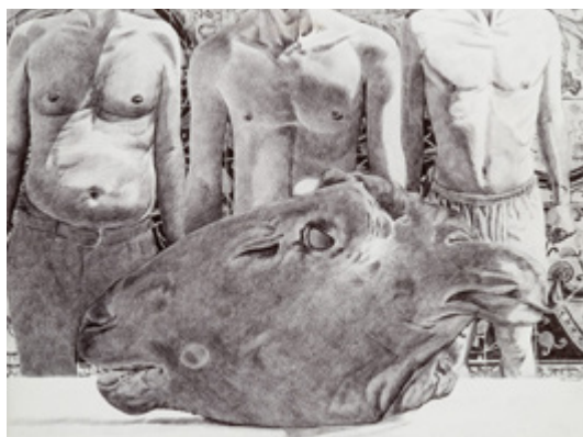
شکل ۳: احمد مرشدلو، چشم سر، ۱۳۹۵ (URL1, 2021)