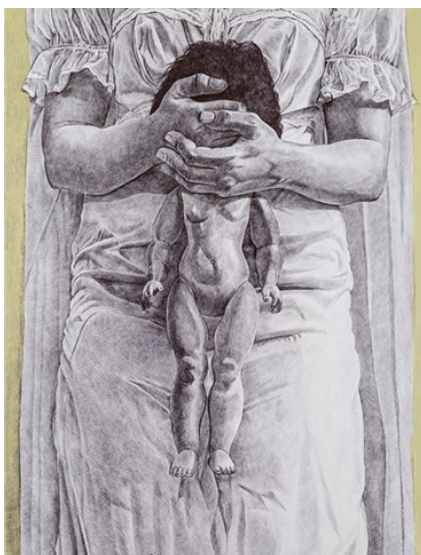
شکل ۴: احمد مرشدلو، بدون عنوان، ۱۳۹۵ (URL1, 2021) Figure 4: Ahmad Morshedlo, Untitled, 2016 (URL1, 2021)