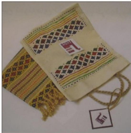
تصویر ۲: طراحی بسته‌بندی مصرفی منسوجات صنایع دستی، بسته‌بندی محصولات سرامیکی از جنس مقوا. Image. 2: Design of consumer packaging of handmade textiles, Cardboard ceramic carton packaging (Qasemkhani, 2010)