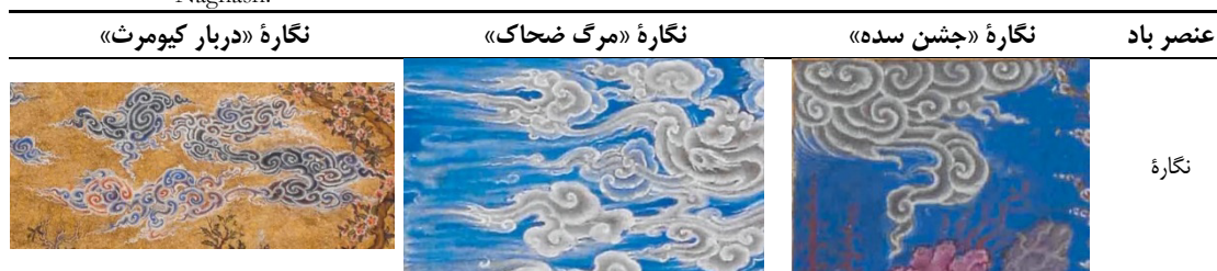
Table 8. The use of the element of wind in a selection of works by the painter Sultan Mohammad Naghash.

با توجه به حضور عناصر اربعه از لحاظ بصری می‌توان چنین بیان کرد که عنصر خاک نسبت به عناصر آب، آتش و باد، بیشترین حضور بصری را در نمونه‌های مطالعاتی این جستار دارا است. عنصر خاک در نگاره‌های «جشن سده»، «مرگ ضحاک» و «دربار کیومرث»، با توجه به پیوند ذهن تخیلی سلطان محمد نقاش با مضامین این آثار و همچنین با در نظر گرفتن وجه دوگانه عناصر اربعه از دیدگاه باشلار، هم‌زمان بیانگر مرگ و زندگی است. در نگاره‌های «جشن سده» و «دربار کیومرث»، عنصر خاک نشان دهنده نشاط و زندگی است، در حالی که در نگاره «مرگ ضحاک» این عنصر، القاکننده مرگ است که با موضوع اثر همخوانی دارد. از این رو، سلطان