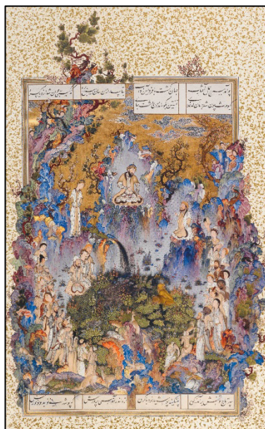
شکل ۴. دربار کیومرث، شاهنامه طهماسبی، موزه بریتانیا (Canby, 2011, p. 27).

نگاره «دربار کیومرث» یکی از زیباترین آثار به‌جامانده از سلطان محمد نقاش است که شکوه و عظمت پادشاه ایرانی را به تصویر می‌کشد. در این اثر، طبیعت، حیوانات و رنگ‌های زنده، فضایی آرمانی و اسطوره‌های خلق کرده‌اند (شکل ۴). باشلار، معتقد است که تخیل هنری می‌تواند طبیعت را به جهانی رؤیایی و شاعرانه تبدیل کند (باشلار، ۱۳۷۸: ۴۰). در این نگاره، سلطان محمد با ترکیب عناصر طبیعت (آب، خاک و باد) و انسان، جهانی هماهنگ و ایدئال را به تصویر کشیده است که ریشه در اسطوره‌های ایرانی دارد (جدول ۴). در این تصویر همچون نگاره «مرگ ضحاک» تنها، عنصر آتش به‌کاررفته گرفته نشده است.