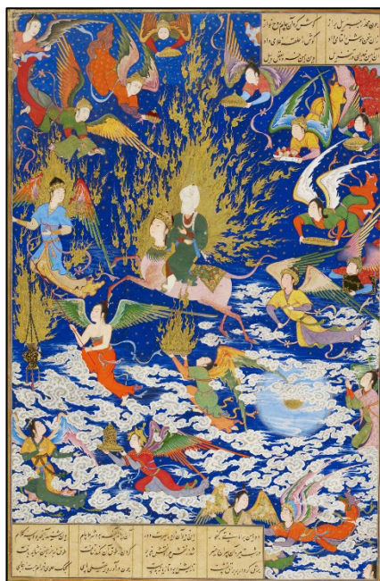
شکل ۱. معراج پیامبر، خمسه نظامی، موزه بریتانیا (Azhand, 2006, p. 169).