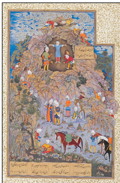
شکل ۳. مرگ ضحاک، شاهنامه طهماسبی، موزه متروپولین (Canby, 2011, p. 38).