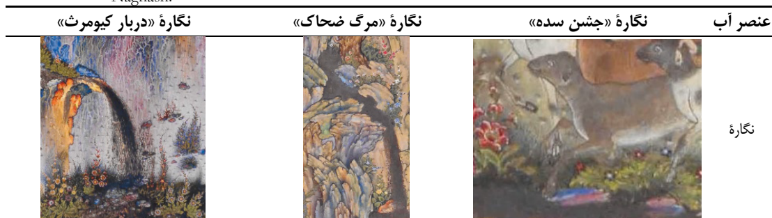
Table 5. The use of the element of water in a selection of works by the painter Sultan Mohammad Naghash.

استفاده از رنگ در منتخبی از نگاره‌های سلطان محمد نقاش، همچون رنگ‌های قرمز و نارنجی، نمادی از آتش، حس گرما و شور را منتقل می‌کند. این عنصر در نگاره‌های «معراج پیامبر» و «جشن سده» بیشتر نمود پیدا کرده و دلیل آن موضوعات این نگاره‌ها است چراکه عنصر آتش در «معراج پیامبر» بیانگر عروج به آسمان و در نگاره «جشن سده» نمایانگر شادی و لذت است و مطالب ذکر شده در مورد عنصر آتش با نقد تخیلی باشلار کاملاً همخوانی دارد. سلطان محمد نقاش با آگاهی از نقش این عنصر با موضوعات نگاره‌های فوق، به خلق اثر تخیلی-مذهبی با استفاده از عنصر آتش در نگاره «معراج پیامبر» اقدام کرده است (جدول ۶).