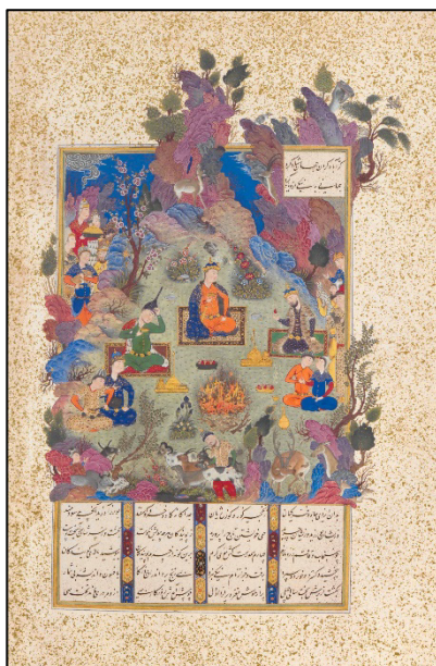
شکل ۲. جشن سده، شاهنامه طهماسبی، موزه متروپولین (Canby, 2011, p. 29).