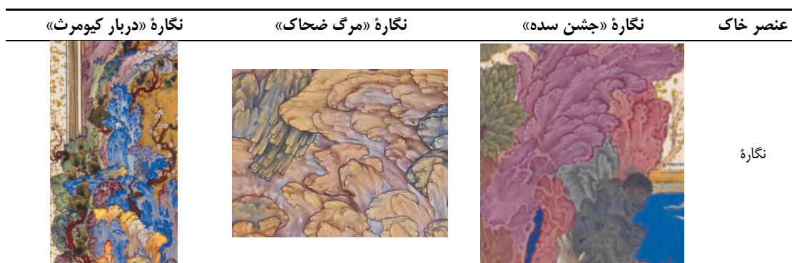
Table 7. The use of the element of soil in a selection of works by the painter Sultan Mohammad Naghash.

در تمامی نگاره‌های مورد بحث در این پژوهش، عنصر باد با حضور و جهت‌گیری ابرهای پیچان نشان داده شده است. آثار سلطان محمد نقاش، با برخورداری از فضای باز و استفاده از عناصر طبیعی، به خصوص باد برای ایجاد عمق پیوستگی در نگاره‌ها، حس رهایی و آزادی را القا می‌کند. این ویژگی، تخیل بی‌کران و شاعرانه‌ای را به مخاطب منتقل می‌نماید (جدول ۸).