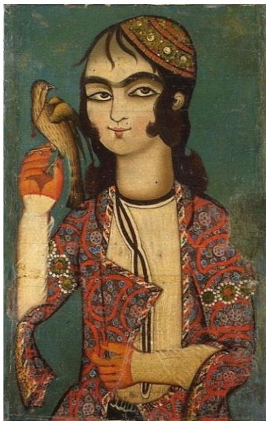
تصویر ۴: پسری که شاهین را نگه داشته است، اواخر قرن ۱۸م، موزه آرمیتاژ. Fig4: Boy Holding a Falcon, Qajar Dynasty, 18th century.