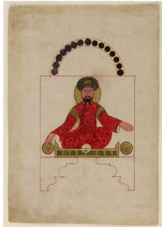
شکل ۲. مصورسازی یکی از بخش‌های ساعت فیلی (مکانیزمی از دستگاه چهارم از نوع اول کتاب جزری) از نسخه خطی شماره ۳۶۰۶ ایاصوفیه مورخ ۷۵۵ قمری، محل نگهداری این صفحه در نگارخانه هنر فریر (URL2).