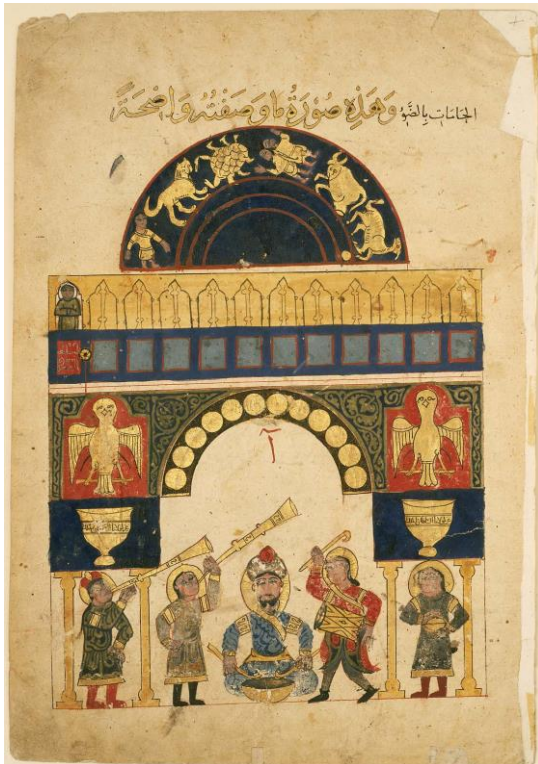
شکل ۳. شکل اصلی دستگاه اول از نوع اول کتاب جزری از نسخه خطی شماره ۳۶۰۶ ایاصوفیه مورخ ۷۵۵ قمری، محل نگهداری این صفحه در موزه هنرهای زیبای بوستون (URL3).

خط کوفی، در جناح سمت راست «عز لمولانا السلطان المالک، العالم العدیل» خوانده می‌شود و در جناح سمت چپ ادامه می‌یابد «المؤید نورالدین ابوالفتح محمد بن قرا ارسلان»، روی هم رفته «افتخار به سرور ما پادشاه حکمفرما، دانا، عادل، مخدوم، نورالدین ابوالفتح محمد بن قرا ارسلان»؛ طبق آنچه به درستی توسط دکتر مارتین - که به هر ترتیب نمی‌تواند خوانش متن را انجام دهد - مطرح شده است. در امتداد بالای کتیبه خوانده می‌شود: «الملک لله الواحد القهار»، «حق