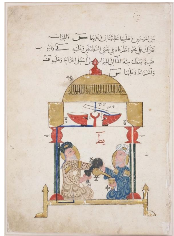
شکل ۶. شکل اصلی دستگاه نهم از نوع دوم کتاب جزری از نسخه خطی شماره ۳۶۰۶ ایاصوفیه مورخ ۷۵۵ قمری، محل نگهداری این صفحه در موزه هنرهای زیبای بوستون (URL3).