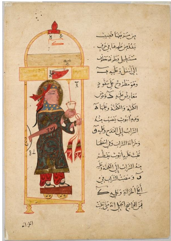
شکل ۱۰. شکل اصلی دستگاه دهم از نوع دوم کتاب جزری از نسخه خطی شماره ۳۶۰۶ ایصوفیه مورخ ۷۵۵ قمری، محل نگهداری این صفحه در موزه هنر هاروارد (URL5).

پنجم از نوع پنجم) و نهایتاً در شکل ۱۰ دستگاه دهم از نوع دوم که مجسمه کنیزکی است که شربت را برای حضار می‌ریزد، مصورسازی شده است. در تمام این موارد عملکرد دستگاه‌ها با ادبیات کوماراسوامی یا طبق ترجمه متن جزری تبیین شده است و در پایان، کتاب‌شناسی و سپس فهرست مصورسازی‌ها و تصاویر درج شده و کتابچه، بدون هیچ‌گونه جمع‌بندی یا نتیجه‌گیری به پایان رسیده است.