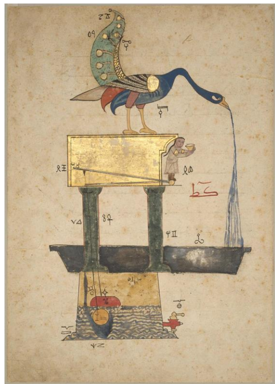
شکل ۷. شکل اصلی دستگاه نهم از نوع سوم کتاب جزری از نسخه خطی شماره ۳۶۰۶ ایاصوفیه مورخ ۷۵۵ قمری، محل نگهداری این صفحه در موزه هنرهای زیبای بوستون (URL3).

۱۱۷۴ تا ۱۱۸۵ میلادی) روی یکی از شکل‌های اصلی نمایش داده شده است. بر این اساس، به نظر می‌رسد که مصورسازی‌ها در این نسخه خطی، ابداعاتی را نشان می‌دهند که قبلاً برای سلطان خاصی ساخته شده یا بنا برده ساخته شده، و این که این مصورسازی‌ها از یک نسخه خطی در نسخه خطی دیگر رونوشت شده‌اند، بدون این که به سلطان حکمفرما در زمان نسخه‌برداری ارجاع داده شوند. به بیان دیگر، این کتیبه‌ها که بخشی از متن اثر نیستند، به تنهایی هیچ مدرکی از تاریخ نسخه خطی را ارائه نمی‌دهند بلکه صرفاً تاریخ ساخت یک اختراع اختصاصی را نمایش می‌دهند (Coomaraswamy, 1924: 7).