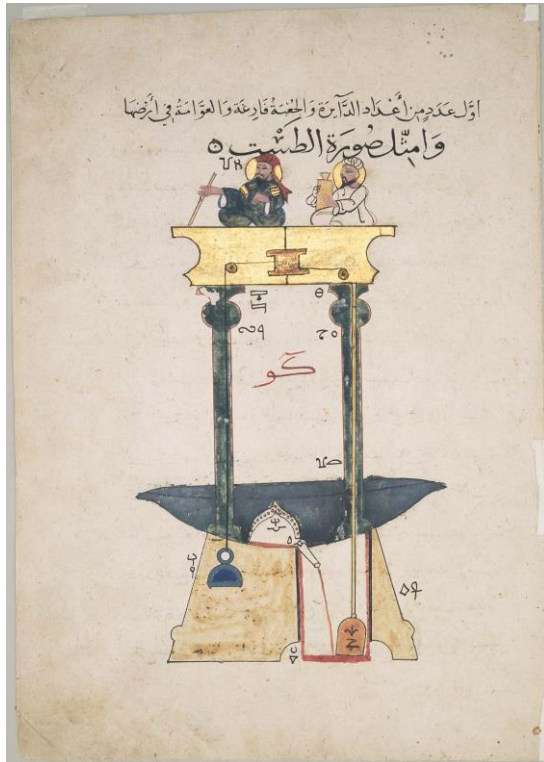
شکل ۵. شکل اصلی دستگاه ششم از نوع سوم کتاب جزری از نسخه خطی شماره ۳۶۰۶ ایاصوفیه مورخ ۷۵۵ قمری، محل نگهداری این صفحه در موزه هنرهای زیبای بوستون (URL3).

صلاح الدین، اگر صحیح در نظر گرفته شود، می بایست عنوانش «الملک الناصر» به جای «الملک الصالح» باشد. دکتر مارتین یک اشتباه را در بخشی از متن نسخه فرض می کند: اما احتمال ندارد که نسخه ای اسلامی در عنوان یک سلطان حکفرما مرتکب اشتباه شده باشد و باور کردنی نیست که او در عنوان صحیح سلطانی که پانزده یا بیست سال بر تخت نشسته و عملاً حامی کتاب جزری است، اشتباه کرده باشد (Coomaraswamy, 1924: 2-3).