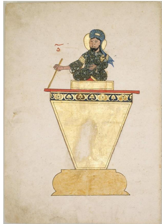
شکل ۴. شکل اصلی دستگاه پنجم از نوع اول کتاب جزری از نسخه خطی شماره ۳۶۰۶ ایاصوفیه مورخ ۷۵۵ قمری، محل نگهداری این صفحه در موزه هنرهای زیبای بوستون (URL3).