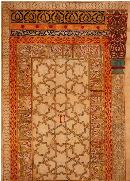
شکل ۱. مصورسازی طرح درب قصر شهر آمد در دیاربکر از نسخه خطی شماره ۳۴۷۲ تویقایی از کتاب جزری (URL1).

Fig 1. Illustration of the design of the door of Amida Palace in Diyarbakir from manuscript N. 3472 of Topkapi from the book of Jazari (URL1).