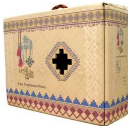
تصویر ۱: بسته‌بندی گلیم فارس. بسته‌بندی یک کالای هویتی می‌تواند با استفاده از نشانه‌های آشنای محلی یا ملی شکل گیرد. Image. 1: Felicion packing. The packaging of an item of goods can be made using familiar local or national indications (Gasemkhani, 1389).

طراحی بسته‌بندی نشان می‌دهد که ارزش‌های فرهنگی زیادی در بازار وجود دارد. از زمانی که طراحی بسته‌بندی به صورت ابتدایی در بازار شکل گرفت (سوپرمارکت، کالاهای جمعی یا فروشگاه‌های بزرگ) جایی که مردم پیش‌زمینه‌ی فرهنگی متنوع و با ارزش در کنار هم دارند، فوراً باید توجه مصرف‌کننده را جلب کنند. از طریق تحقیقات گسترده در بازار و برنامه‌ریزی به کارگیری از عناصر طراحی، نشانه‌های فرهنگی در خدمت ارزش‌های فرهنگی قرار می‌گیرند. تأثیر واقعی طراحی بسته‌بندی مصرف‌کننده را وادار می‌کند که خود و آرمان‌هایش را در طراحی عناصر بسته‌بندی ببیند.