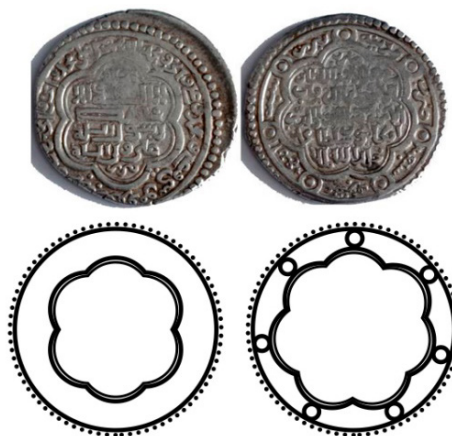
شکل ۵. سکه اولجایتو ایلخانی (zeno, n.d)

نقش هندسی دایره دو خطی در مرکز - خط دایره دور سکه و خط و قرار گیره دو شکل خطی در هم تنده به شکل دو قلب درهم تنده و چسبیده به تنه ی حرف الله و یک شکل خطی اسپیرال دوطرفه که در وسط شکل قلب را ایجاد کرده است.