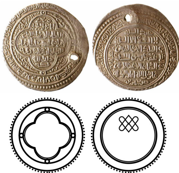
شکل ۱. سکه‌ی اولجایتو ایلخانی (sahebdivan, n.d)

سکه‌های ایلخانی مجموعه‌ای از سکه‌های تاریخی گوناگون‌اند که در دوران استیلای ایلخانان مغول بر فلات ایران ضرب شده‌اند و شامل انواع طلا، نقره و مس می‌شوند نمونه‌های حاضر از سکه‌های نایاب دوره‌ی اولجایتو هستند که در تبریز ضرب شده‌اند.