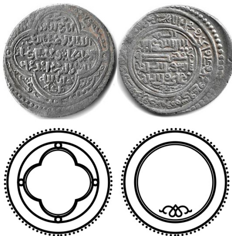
شکل ۳. سکه‌ی اولجایتو ایلخانی (zeno, n.d)

نقش گل هفت‌پر گرد در مرکز با هفت نقطه و دایره‌ی کوچک چسبیده به خط دور سکه - خط دایره دور سکه و خط با نقطه چین دور آن. (شکل ۲)