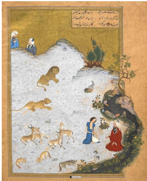
شکل ۲: دیدار مجنون با سلیم عامری در بیابان، کمال الدین بهزاد، خمسه نظامی، هرات، ۸۹۹ ه.ق، ۱۴/۸×۱۷ سانتی‌متر، کتابخانه بریتانیا