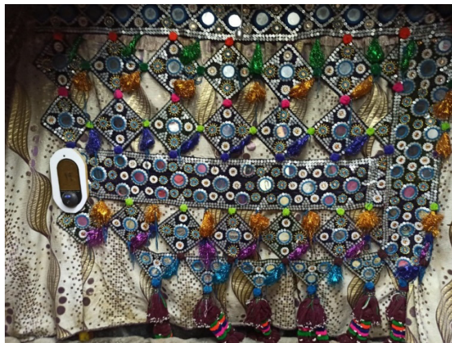
شکل ۳: سکه چلچوک، (Noori, 2022)