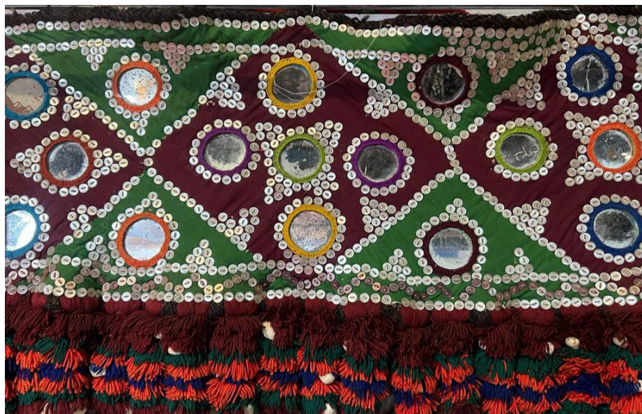
شکل ۴: سکه‌دوزی بلوچستان، (Noori, 2022)

در (شکل ۴)، نمونه‌ای دیگر از سکه‌دوزی بلوچستان را مشاهده می‌کنیم که بر روی پشم بز دوخته شده است. ابعاد این نمونه معمولاً در ۳ یا ۴ متر طول و ۵۰ یا ۶۰ سانتی‌متر عرض است. در پشت کار، حلقه‌های فلزی دست‌ساز نصب می‌شود تا بتوانیم سکه را به دیوار آویز کنیم. طرح زمینه، برگرفته از نقوش لوزی مانند و مثلث است که توسط برش پارچه‌های مخملی، شکل گرفته است. طرح اصلی در داخل هر لوزی، نقوش پنج‌آینه‌ای است که اطراف آینه‌ها با نخ‌های رنگی به صورت قاب‌بندی دوخته شده است. وجود دکمه‌های صدفی در اطراف قاب آینه‌ها به صورت اشکالی چون گرده، ستاره‌ای، مثلثی و در حاشیه، به صورت نوارهایی با تزیین زیگزاگی دیده می‌شود. در اطراف دل کار (لوزی‌ها)، مثلث‌هایی با نقش تک آینه شکل گرفته است. سکه موجود دارای دو حاشیه باریک یکی در بالا و دیگری در پایین و یک زمین در بین دو حاشیه را دارا است. در انتها، منگوله‌هایی (پُلک‌ها) به صورت مشتی تمام طول پایین سکه را تزیین کرده است. بین مشتی‌ها کُچک قرار گرفته است و قرینگی نقوش و طرح در تمامی تزیینات دیده می‌شود.