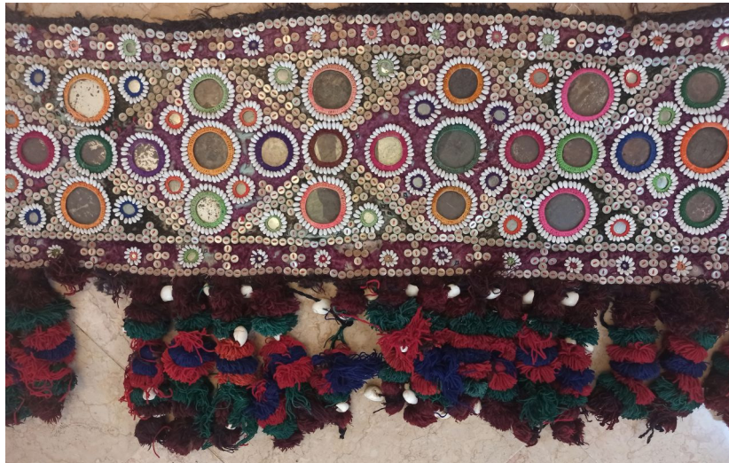
شکل ۱: سکه‌دوزی بلوچستان، (Noori, 2022)