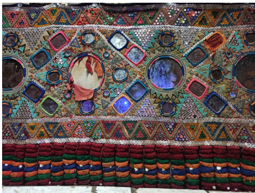
شکل ۲: سکه‌دوزی بلوچستان، (Noori, 2022)

در (شکل ۲)، سکه‌ای را مشاهده می‌کنیم که مربوط به بخش جنوبی بلوچستان، منطقه مکران است. تولید اثر مربوط به دهه ۱۳۴۰ ه.ش است. جل یا زمینه اصلی، ترکیب بزرگ‌تری نسبت به ریشه‌ها دارد. در این نمونه، استفاده از سکه جایگاه کم‌تری در کار دارد و مرواریدهای رنگی بخش بیشتری از تزیینات را تشکیل داده است. استفاده از فلز در این نمونه مشاهده می‌شود که همانند قابی اطراف ریز آینه‌ها را دربر گرفته است. طرح و نقش در این نمونه، از سکه‌دوزی تحت تأثیر فرهنگ و هنر هندوستان است و دلیل آن نزدیکی منطقه مکران به هندوستان است. در زمینه اصلی، وجود آینه‌های گرد بزرگ را مشاهده می‌کنیم که اطراف آن با آینه‌های کوچک در دو سایز مختلف تزیین شده است. آینه‌های مربع در نقوش زمینه قابل مشاهده است. اطراف تخته اصلی، دو حاشیه یکی در بالا و دیگری در پایین تزیین شده است. خطوط اصلی حاشیه با سکه (دکمه‌های صدفی) تزیین شده و طرح حاشیه‌ها طرح‌های چوتل و مثلثی هستند که توسط دکمه‌ها و مرواریدهای رنگی شکل گرفته است. نقوشی چون دایره، مربع، لوزی و مثلث تمامی طرح‌ها و نقش‌های سکه را تشکیل داده است. وجود پلک‌های یک‌دست و قرینه در انتهای اثر را که به حاشیه پایینی متصل شده‌اند، مشاهده می‌کنیم. کچک‌های بزرگ در لابه‌لای پلک‌های مшти به سکه زیبایی بیشتری می‌بخشند.