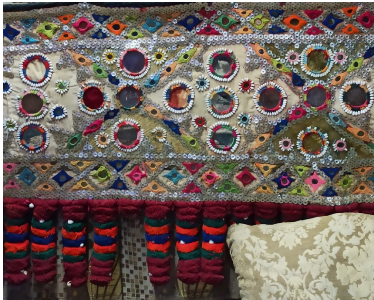
شکل ۶: سکه‌دوزی بلوچستان، (Noori, 2022)

رنگ زمینه به صورت رنگ سبز روشن و صورتی (گل‌پهی) انتخاب شده است که به مرور زمان، رنگ‌های مخمل از بین رفته‌اند و فقط در نقاطی محدود مشاهده می‌شوند و تنها زمینه کرم رنگی از زمینه بافت مخملی به جای مانده است. وجود رنگ سبز به عنوان رنگ اصلی، سبب درخشش رنگ‌های دیگر شده است. طیف رنگ‌های سبز روشن در سوزن‌دوزی‌های زمینه نیز مشاهده می‌شود. در ریشه‌ها، سبز تیره بیانی از تداوم و اعتبار را تداعی می‌کند. نارنجی مخمل زمینه در ملایم‌ترین حالت به کار گرفته شده است و نشان از رنگ گل‌پهی دارد. ترکیب رنگی فراوان در تمامی اثر قابل مشاهده است. در اطراف آینه‌ها، نخ‌های قاب‌دوزی نیز به صورت ترکیبی از رنگ‌های مختلف دیده می‌شود. وجود رنگ آبی در زمینه، حاشیه و ریشه‌ها به صورت کهرنگ و پر رنگ، احساسی از آرامش را در تمام سکه‌دوزی نمایان می‌سازد. وجود رنگ صورتی که در اطراف برخی ریز آینه‌ها سوزن‌دوزی شده است، نوعی مؤنث بودن و زنانگی را بیان می‌کند. در کنار آن، رنگ‌هایی چون نارنجی و قرمز مشاهده می‌شود. نارنجی نیز مانند قرمز سرخی آتش را نشان می‌دهد و در بیان، به عشق و شادی می‌پردازد. قرمز همانند نمونه‌های قبلی به صورت پرکاربردترین رنگ در هنر سکه‌دوزی پدیدار می‌شود و در ریشه‌های اثر نیز قابل مشاهده است. رنگ جدیدی همانند قهوه‌ای روشن و خردلی در این نمونه وجود دارد که در نمونه‌های قبلی مشاهده نمی‌شود.