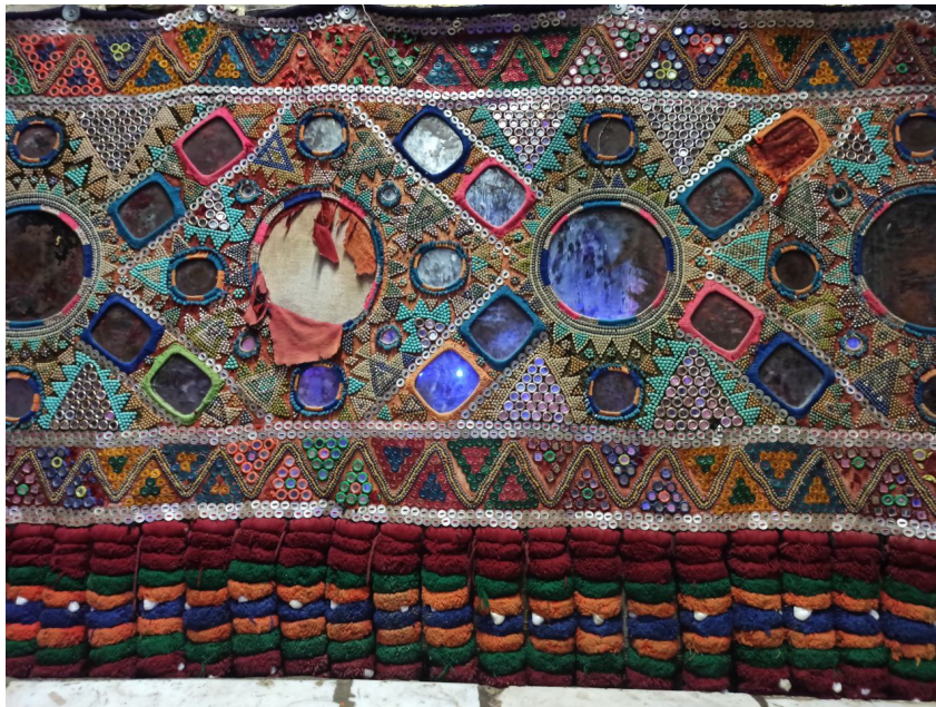
شکل ۲: سکه‌دوزی بلوچستان، (Noori, 2022)

در (شکل ۲)، سکه‌ای را مشاهده می‌کنیم که مربوط به بخش جنوبی بلوچستان، منطقه مکران است. تولید اثر مربوط به دهه ۱۳۴۰ ه.ش است. جل یا زمینه اصلی، ترکیب بزرگ‌تری نسبت به ریشه‌ها دارد. در این نمونه، استفاده از سکه جایگاه کم‌تری در کار دارد و مرواریدهای رنگی بخش بیشتری از تزیینات را تشکیل داده است. استفاده از فلز در این نمونه مشاهده می‌شود که همانند قابی اطراف ریز آینه‌ها را دربر گرفته است. طرح و نقش در این نمونه، از سکه‌دوزی تحت تأثیر فرهنگ و هنر هندوستان است و دلیل آن نزدیکی منطقه مکران به هندوستان است. در زمینه اصلی، وجود آینه‌های گرد بزرگ را مشاهده می‌کنیم که اطراف آن با آینه‌های کوچک در دو سایز مختلف تزیین شده است. آینه‌های مربع در نقوش زمینه قابل مشاهده است. اطراف تخته اصلی، دو حاشیه یکی در بالا و دیگری در پایین تزیین شده است. خطوط اصلی حاشیه با سکه (دکمه‌های صدفی) تزیین شده و طرح حاشیه‌ها طرح‌های چوتل و مثلثی هستند که توسط دکمه‌ها و مرواریدهای رنگی شکل گرفته است. نقوشی چون دایره، مربع، لوزی و مثلث تمامی طرح‌ها و نقش‌های سکه را تشکیل داده است. وجود پلک‌های یک‌دست و قرینه در انتهای اثر را که به حاشیه پایینی متصل شده‌اند، مشاهده می‌کنیم. کچک‌های بزرگ در لابه‌لای پلک‌های مشتی به سکه زیبایی بیشتری می‌بخشند.