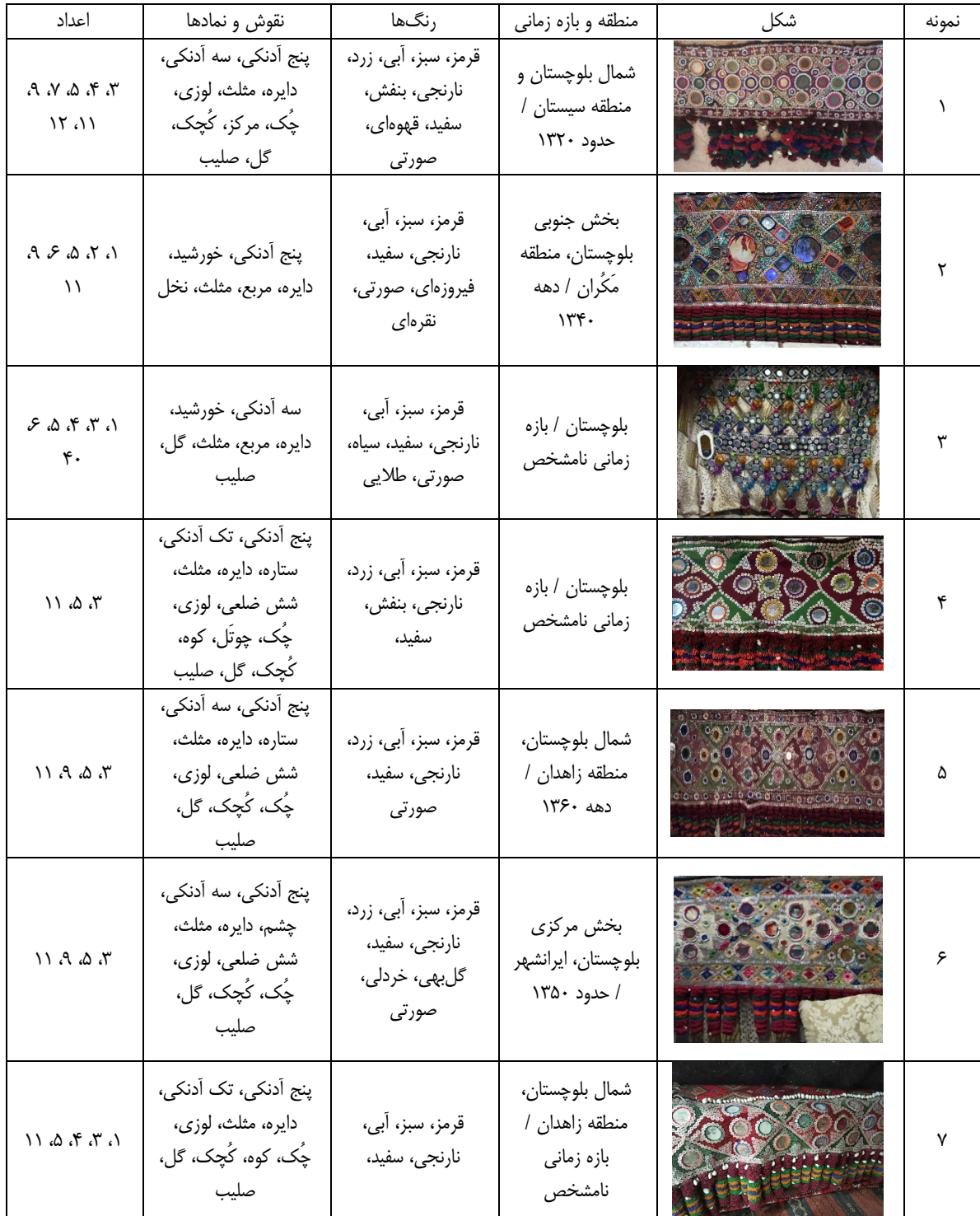
جدول ۱: مقایسه نمونه‌ها