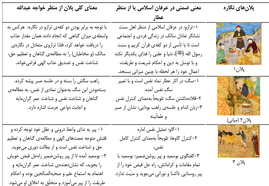
جدول ۳: جزئیات کلیدی نگاره و معانی ضمنی آن‌ها از منظر عرفان اسلامی و تطبیق با آراء خواجه عبدالله انصاری Table 3: Key Details of the Illustration and Their Implicit Meanings from the Perspective of Islamic Mysticism in Comparison with the Views of Khwaja Abdullah Ansari

سهم کاتب: سلطانعلی در این نگاره نیز به دلیل موضوع خاص آن که در فضای باز و زمین زراعی رخ داده است، به دو کتیبه‌ی فوقانی و تحتانی نستعلیق از اشعار عطار اکتفا کرده است، اما سخنان پیر روشن‌ضمیر در ابیات ناتمام می‌ماند و مخاطب برای درک کامل داستان باید به منطلق الطیر مراجعه کند. از فحوای اشعار نوشته‌شده نیز مطلبی دال بر ارتباط با شئون نه‌گانه‌ی یقظه یافت نمی‌شود.