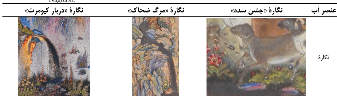
Table 5. The use of the element of water in a selection of works by the painter Sultan Mohammad Naghash.

استفاده از رنگ در منتخبی از نگاره‌های سلطان محمد نقاش، همچون رنگ‌های قرمز و نارنجی، نمادی از آتش، حس گرما و شور را منتقل می‌کند. این عنصر در نگاره‌های «معراج پیامبر» و «جشن سده» بیشتر نمود پیدا کرده و دلیل آن موضوعات این نگاره‌ها است چراکه عنصر آتش در «معراج پیامبر» بیانگر عروج به آسمان و در نگاره «جشن سده» نمایانگر شادی و لذت است و مطالب ذکر شده در مورد عنصر آتش با نقد تخیلی باشلار کاملاً همخوانی دارد. سلطان محمد نقاش با آگاهی از نقش این عنصر با موضوعات نگاره‌های فوق، به خلق اثر تخیلی-مذهبی با استفاده از عنصر آتش در نگاره «معراج پیامبر» اقدام کرده است (جدول ۶).