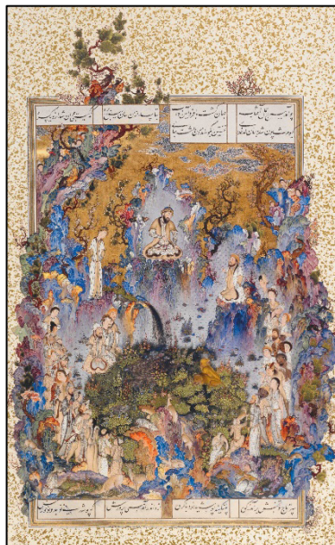
شکل ۴. دربار کیومرث، شاهنامه طهماسبی، موزه بریتانیا (Canby, 2011, p. 27).

نگاره «دربار کیومرث» یکی از زیباترین آثار به‌جامانده از سلطان محمد نقاش است که شکوه و عظمت پادشاه ایرانی را به تصویر می‌کشد. در این اثر، طبیعت، حیوانات و رنگ‌های زنده، فضایی آرمانی و اسطوره‌های خلق کرده‌اند (شکل ۴). باشلار، معتقد است که تخیل هنری می‌تواند طبیعت را به جهانی رؤیایی و شاعرانه تبدیل کند (باشلار، ۱۳۷۸: ۴۰). در این نگاره، سلطان محمد با ترکیب عناصر طبیعت (آب، خاک و باد) و انسان، جهانی هماهنگ و ایدئال را به تصویر کشیده است که ریشه در اسطوره‌های ایرانی دارد (جدول ۴). در این تصویر همچون نگاره «مرگ ضحاک» تنها، عنصر آتش به‌کاررفته گرفته نشده است.