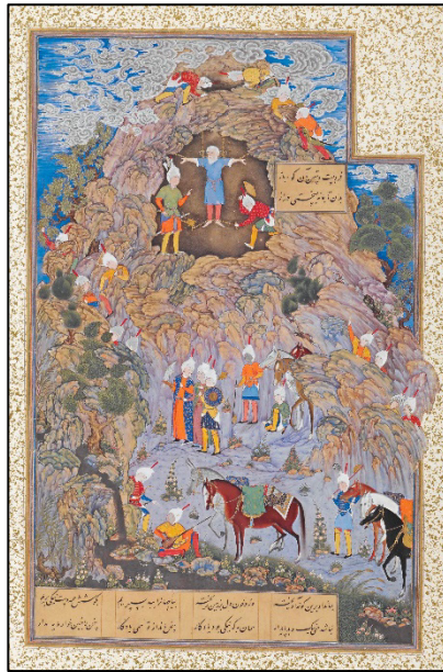
شکل ۳. مرگ ضحاک، شاهنامه طهماسبی، موزه متروپولین (Canby, 2011, p. 38).

Figure 3. Death of Zahhak, Shahnameh of Tahmaspi, Metropolitan Museum (Canby, 2011, p. 38).