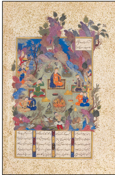
شکل ۲. جشن سده، شاهنامه طهماسبی، موزه متروپولین (Canby, 2011, p. 29).