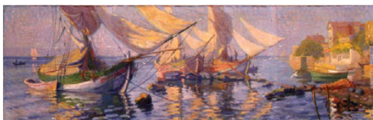
تصویر ۷: نظمی ضیاء، قایق‌های بادبانی، ۱۹۲۴، رنگ و روغن روی بوم (Shaw, 2011).