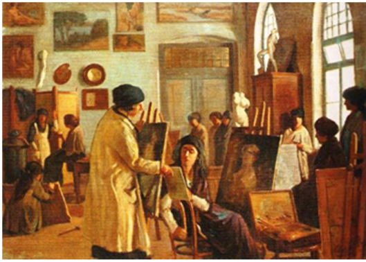
تصویر ۹: عمر عادل، آتلیه زنان، ۱۹۱۵، ۱۱۸×۸۱ سانتی متر، رنگ و روغن روی بوم، محل نگهداری در MSGSU موزه استانبول برای نقاشی و مجسمه‌سازی