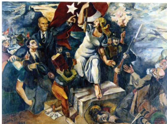
تصویر ۱۰: زکی فائق، در مسیر انقلاب، ۱۹۳۳، رنگ روغن روی بوم (Shaw, 2011)

عهد عثمانی، توجه به هنر و از جمله نقاشی فزونی یافت، زیرا پذیرش هنر مدرن به عنوان شروط لازم و از نشانه‌های «متمدن شدن» یک ملت بود. آتاتورک بنیانگذار جمهوری ترکیه اظهار داشت: «ملتی که نقاشی را نادیده می‌گیرد، ملتی که مجسمه‌ها را نادیده می‌گیرد، و ملتی که قوانین علم پوزیتیو را نمی‌داند، استحقاق یافتن جایگاه خویش در مسیر پیشرفت را ندارد» (Naef, 2003: 166). از این رو «هنر غربی» نمادی از تمدن و «هنر اسلامی» نمادی از عقب‌افتادگی بدل شد و هنرمندان تا حد ممکن از فرهنگ و هنر عثمانی فاصله گرفتند و به جنبش‌های مدرن جلب شدند، این گرایش‌ها مورد حمایت دولت نیز بود. پس از استقرار جمهوری، اولین موزه در سال ۱۹۳۸ تاسیس شد و گروه‌های هنری یکی پس از دیگری شکل گرفتند مانند گروه مستقلان (Müstakiller (The Independents)، گروه D، گروه تازه واردان (Yeniler Grubu (The Newcomers Group)، گروه ده، گروه قلم سیاه، و تاکید بر هویت مدرن و ملی در قالب نمادهای بیانگری مانند آنکارا به عنوان پایتخت جدید یا حتی زنان عربان و حتی خود رهبر جمهوری یعنی «آتاتورک» نمایان می‌شود (تصویر ۱۰). بر اساس آنچه در بالا آمد می‌توان گفت، افق اجتماعی عثمانی از قرن ۱۹ تا سده بیستم مدرنیزاسیون یا نوسازی است که معادل است با غرب‌گرایی و اتخاذ الگوهای غربی برای پیشرفت و در جمهوری ترکیه معادل است با مدرن‌گرایی که سکولاریسم، ملی‌گرایی و جمهوری از مصادیق آن است. جدول شماره یک خلاصه‌ای از آنچه گفته شد نشان می‌دهد.