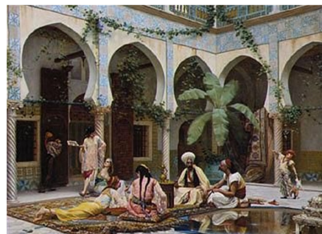
تصویر ۴: سمت راست: حرم سرای کاخ، اثر گوستاو بولانژه، رنگ روغن روی بوم. سمت چپ: حرم، اثر عثمان حمدی، رنگ روغن روی بوم ۶