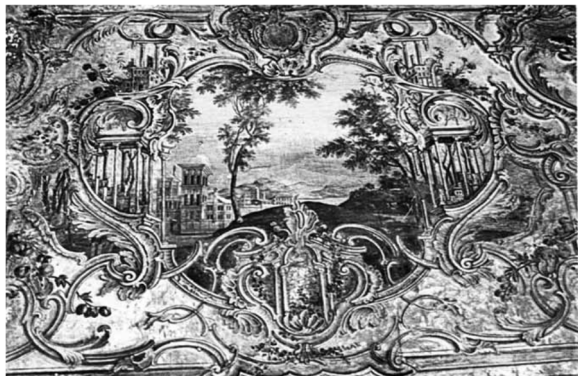
تصویر ۲: هنرمند ناشناس، نقاشی منظره در اتاق سلطان عبدالحمید اول، ۱۷۷۹-۱۷۷۴ (Shaw, 2011: 14)

اجازه رشد سریع در قرن بیستم را ممکن می‌ساخت. از مصادیق این رویکرد تصویب قانون «تام خانوادگی» در سال ۱۹۳۴ بود، به موجب این قانون مصطفی کمال لقب «قاضی» را (به معنای جنگجوی مسلمان که در جهاد مشارکت داشته است) و نمادی مذهبی و سنتی رایج در عثمانی قلمداد می‌شد از نام خود حذف کرد و نام «آتاتورک» را برای خود برگزید (ibid: 63). از دیگر اقداماتی که مصطفی کمال در راستای تغییر فرهنگی-اجتماعی انجام داد جایگزینی قانون مدنی سوئیس به جای شریعت اسلام در سال ۱۹۲۴ بود. او در راستای باورهای خود در سال ۱۹۲۸، الفبا و خط عربی را منع و خط لاتین را جایگزین آن کرد و در سال ۱۹۳۴ اسم عربی «مصطفی» را از نام خود حذف و خود را «کمال آتاتورک» نامید. او همچنین مردان را به استفاده از کلاه‌های غربی اجبار و لباس‌های سنتی زنان را تحقیر و حجاب را در برخی مکان‌ها منع کرد (ibid: pp: 53-54).