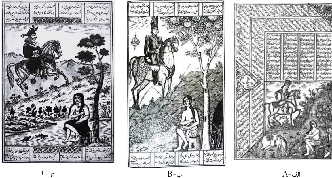
شکل ۵. الف. چاپ سنگی استحمام شیرین در چشمه و دیده‌شدن توسط خسرو: سال ۱۲۶۴ ه.ق. (کاظمی، ۱۳۸۶، ص. ۵۸). ب. چاپ سنگی استحمام شیرین، سال ۱۲۶۹ ه.ق. (خمسه‌ی نظامی، ۱۲۶۹، ص. ۶۷). ج. چاپ سنگی استحمام شیرین، اصفهان، ۱۸۰ × ۱۲۳ سانتی‌متر، اوایل قرن ۱۴ ه.ق.، مجموعه‌ی خصوصی (تناولی، ۱۳۶۸، ص. ۶۴)

پیدایش صنعت چاپ در دوره‌ی قاجار موجب رواج کتب چاپ سنگی شد و بسیاری از صحنه‌های داستان خسرو و شیرین از جمله تصویر آب‌تنی شیرین به صورت چاپ سنگی منتشر شدند و در دسترس عموم قرار گرفتند (شکل ۵).